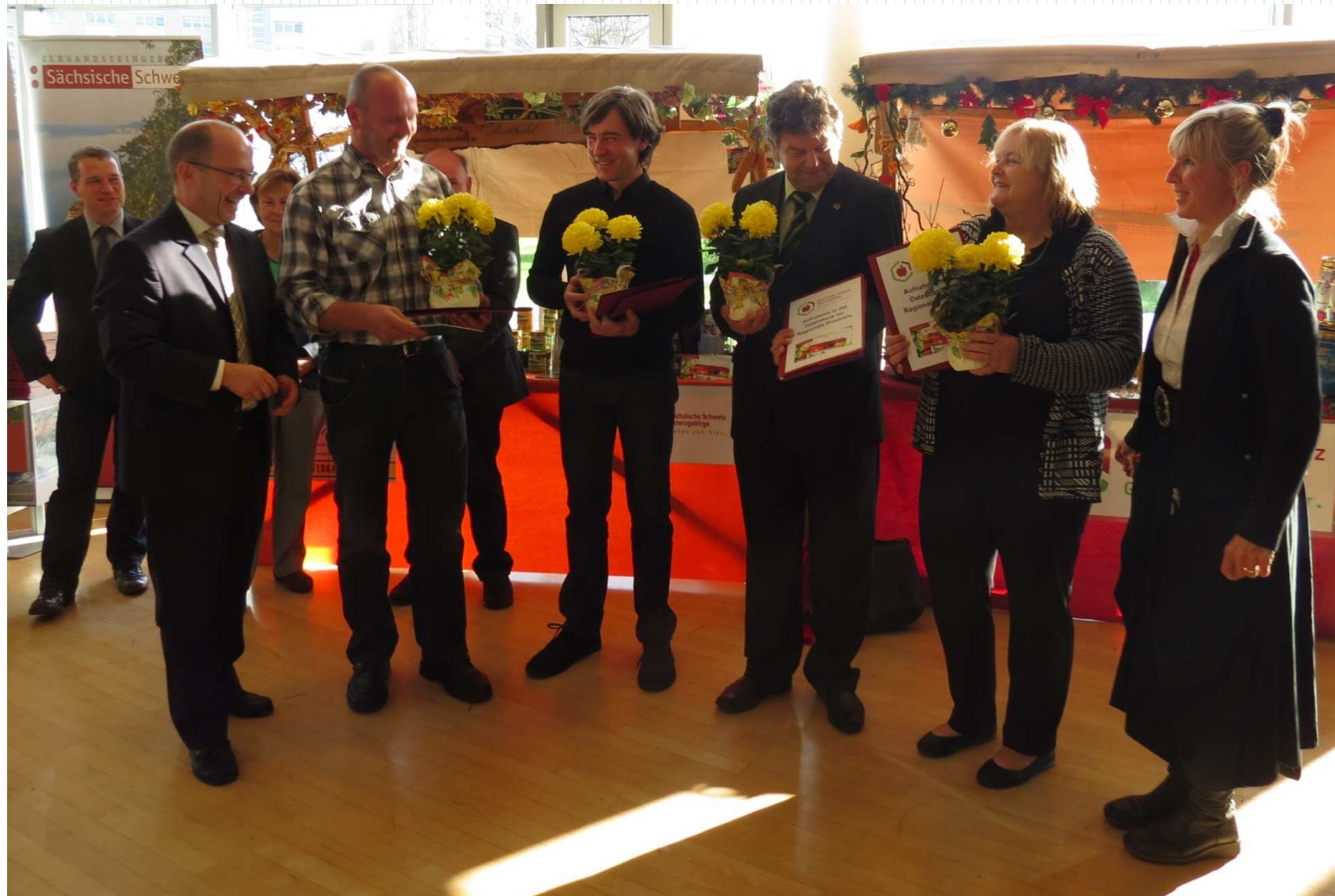
03.11.2014 Regionalbrunch zur Eröffnung mit der Aufnahme der Produzenten Nr. 49 und 50 sowie den ersten Gastronomiebetrieben