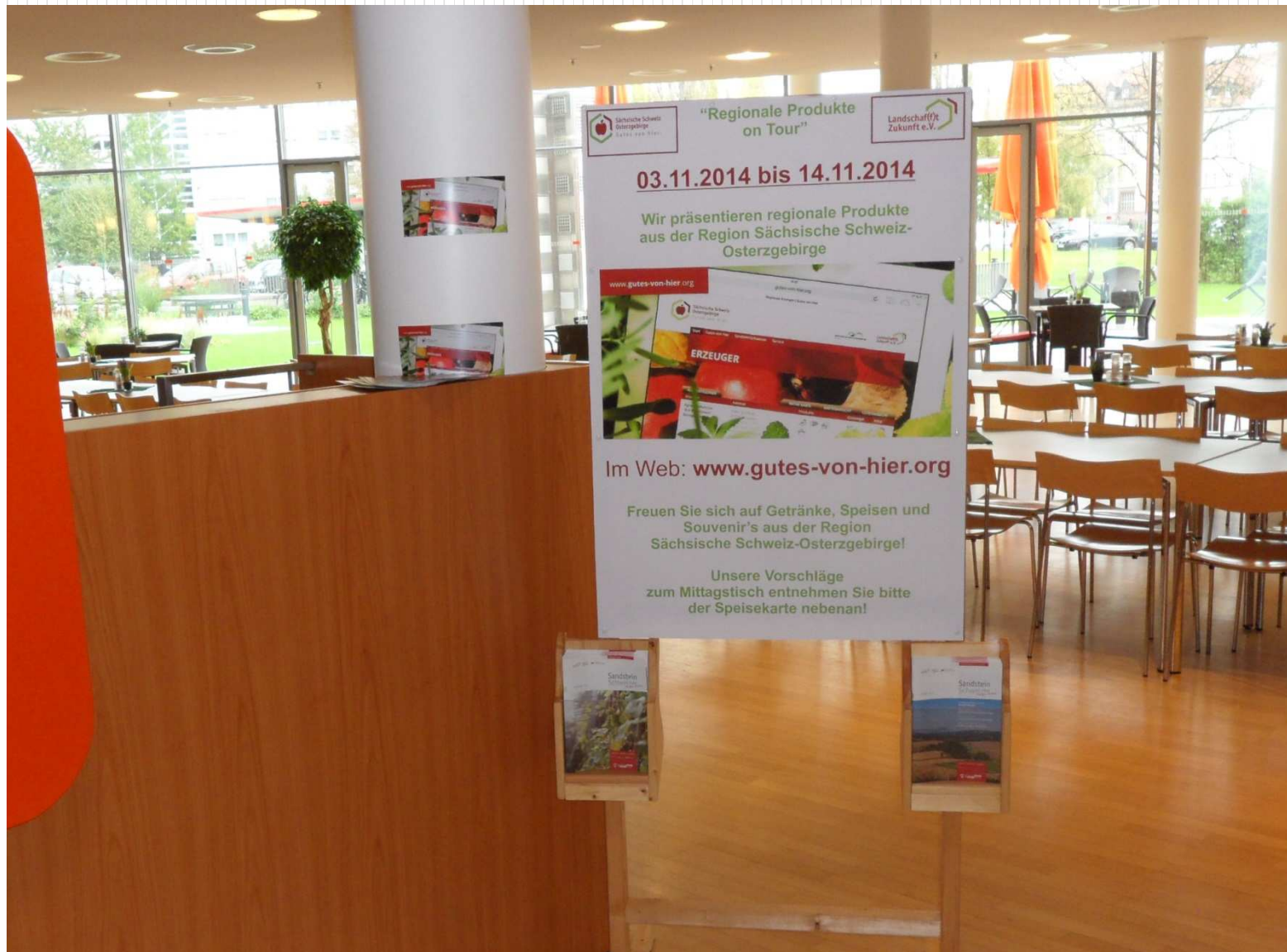
03.11.2014 – 14.11.2014 - Regionalen Produkte on Tour in der Cafeteria der Ostsächsischen Sparkasse Dresden