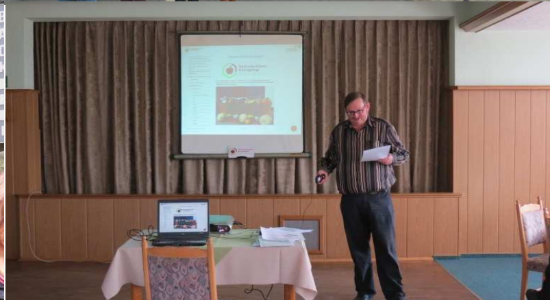
11.02.2014 – Exkursion Regionalvermarktung (SMUL, LfULG)