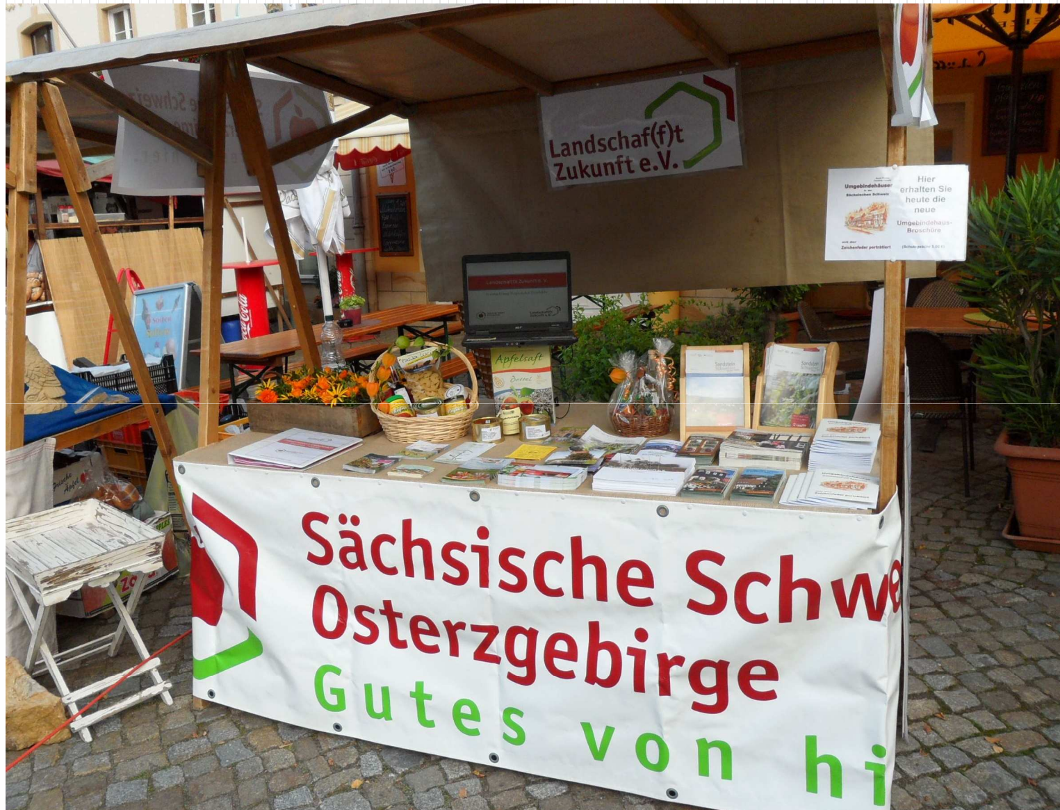
07.09.2014 - 18. Naturmarkt Sächsische Schweiz in Wehlen