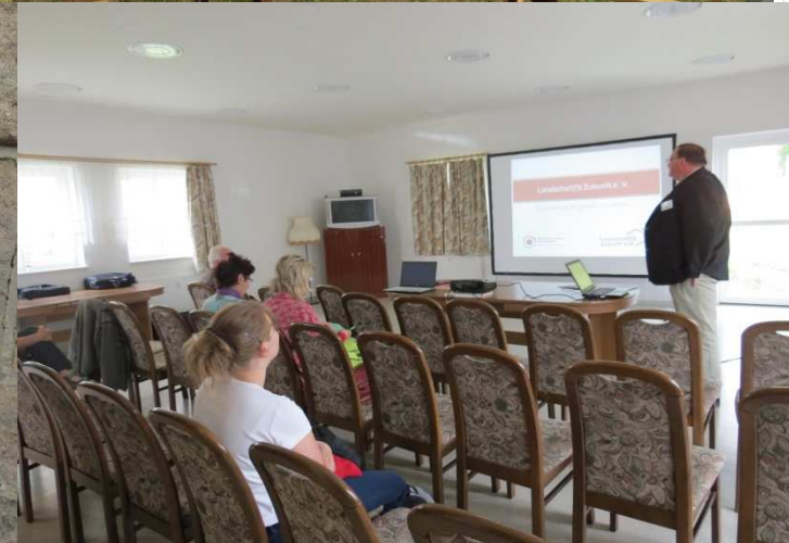
28. / 29.06.2014 – Tage des ländlichen Raumes in Langburkersdorf