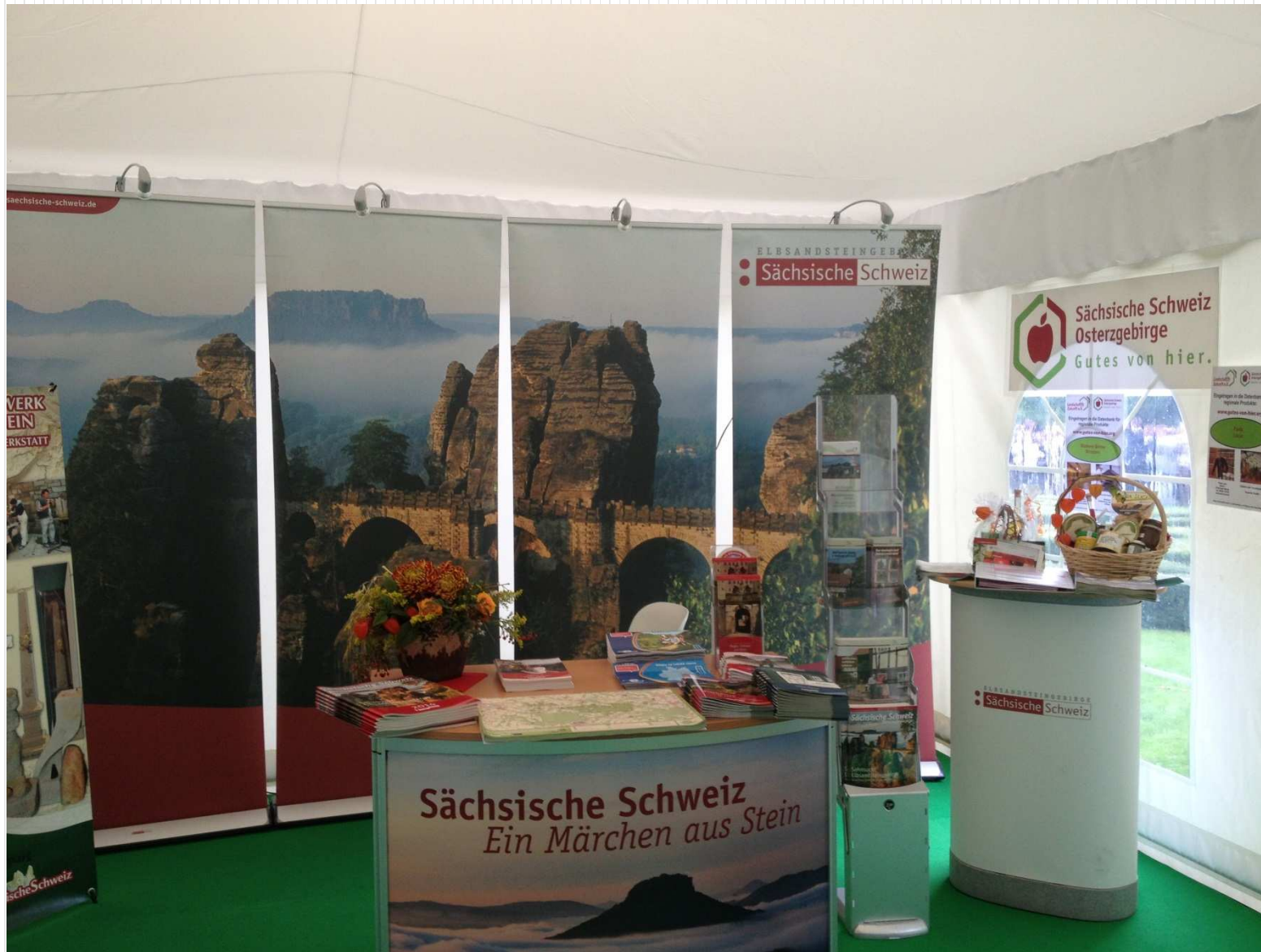
30.09.2014 - Regionalen Produkte on Tour in der Prager Botschaft