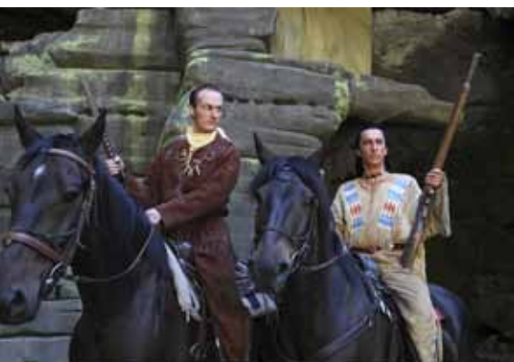
Der Klassiker – Winnetou und Old Shatterhand begeistern alljährlich tausende Zuschauer.