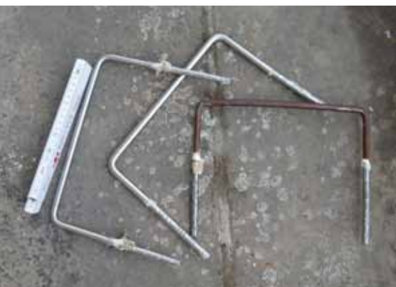
Die Nationalparkwacht hat die Klammern auch der zweiten illegalen Stiege bei Porschdorf unmittelbar nach Bekanntwerden gezogen.

2,9 Millionen Besuchern pro Jahr nutzen diese Wege, die höchste Zahl in einem deutschen Nationalpark. Allein daraus ergibt sich eine hohe Verantwortung.