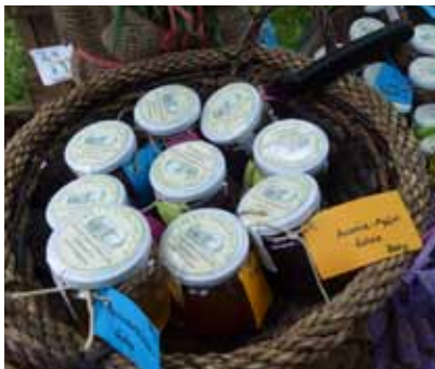
Regionale Produkte aus dem Hause „Steingut“