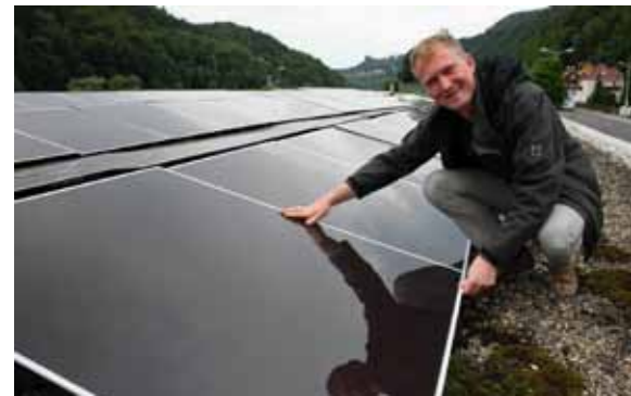
Mit Solarenergie werden in Schmilka Urlaubskoffer transportiert.

Bereits über 13.000 kWh Strom konnten mit den Solaranlagen im April und Mai erzeugt werden.