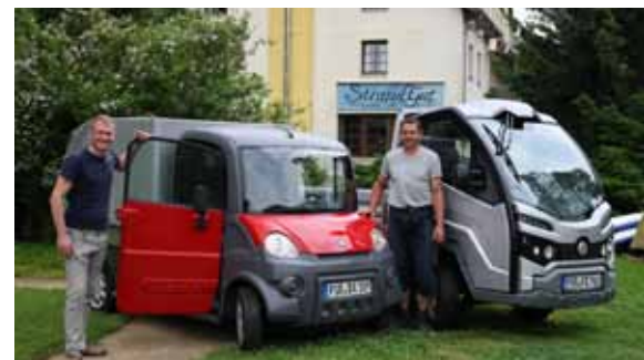
Der neue Stolz vom Bio- und Nationalparkhotel ist die Elektroflotte für kurze Wege.