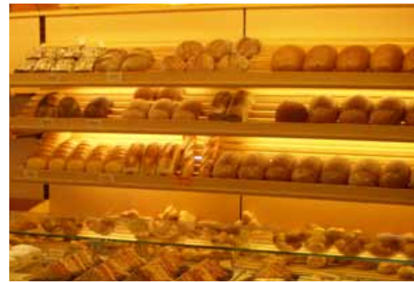
Reichhaltiges Backangebot im einzigen Ladengeschäft in Struppen

Ein weiteres Betätigungsfeld ist das Catering. Auch hierbei schließt sich der Kreislauf zur Region. Unter den Angeboten befinden sich z.B. Leckereien vom Spieß. So werden Wildschweine aus der Sächsischen Schweiz (Cunnersdorf, Bahratal), Hausschweine und Rinder der Agrarproduktion Struppen über Buchenholz gegrillt. Auch ein Galoway aus dem Bestand des Nationalparks wurde schon zubereitet. Gern erstellt das Bäckerteam interessierten Kunden ein Angebot, oder berät Sie zur Ausgestaltung der verschiedensten Feiern.