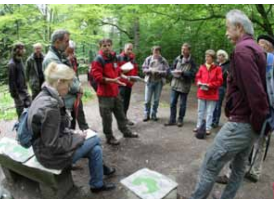
Pressekonferenz am 13.06.2012 zur Arbeit der AG „Wege im Nationalpark“ am Steinernen Tisch