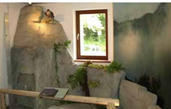
Klein aber fein – der neue Infopunkt berichtet über Faszination des Klettersports, die Einmaligkeit der Sandsteinfelsen und deren Schutzbedürftigkeit. Die Eröffnung des Infopunktes in Schmilka (Wanderweg zum Winterberg, letztes Haus links) findet am 22. Juli von 14-18 Uhr statt.

Die Nationalparkverwaltung hat zu den Vorfällen Anzeige gegen Unbekannt erstattet.