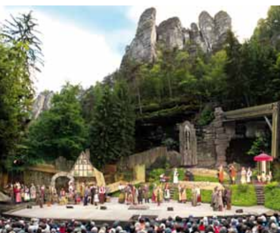
Die Umgebung ist einmalig – die Wehltürme geben eine spektakuläre Kulisse für jede Aufführung.