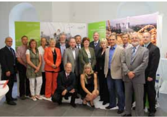
Gründungsmitglieder, der aktuelle Vorstand, aktuelle Mitglieder, sowie die beiden Regionalmanagements der ILE Regionen "Silbernes Erzgebirge und "Sächsische Schweiz" zur feierlichen Eröffnung der Festwoche und Wanderausstellung zum 10-jährigen Jubiläum des Landschaft(f)t Zukunft e. V.