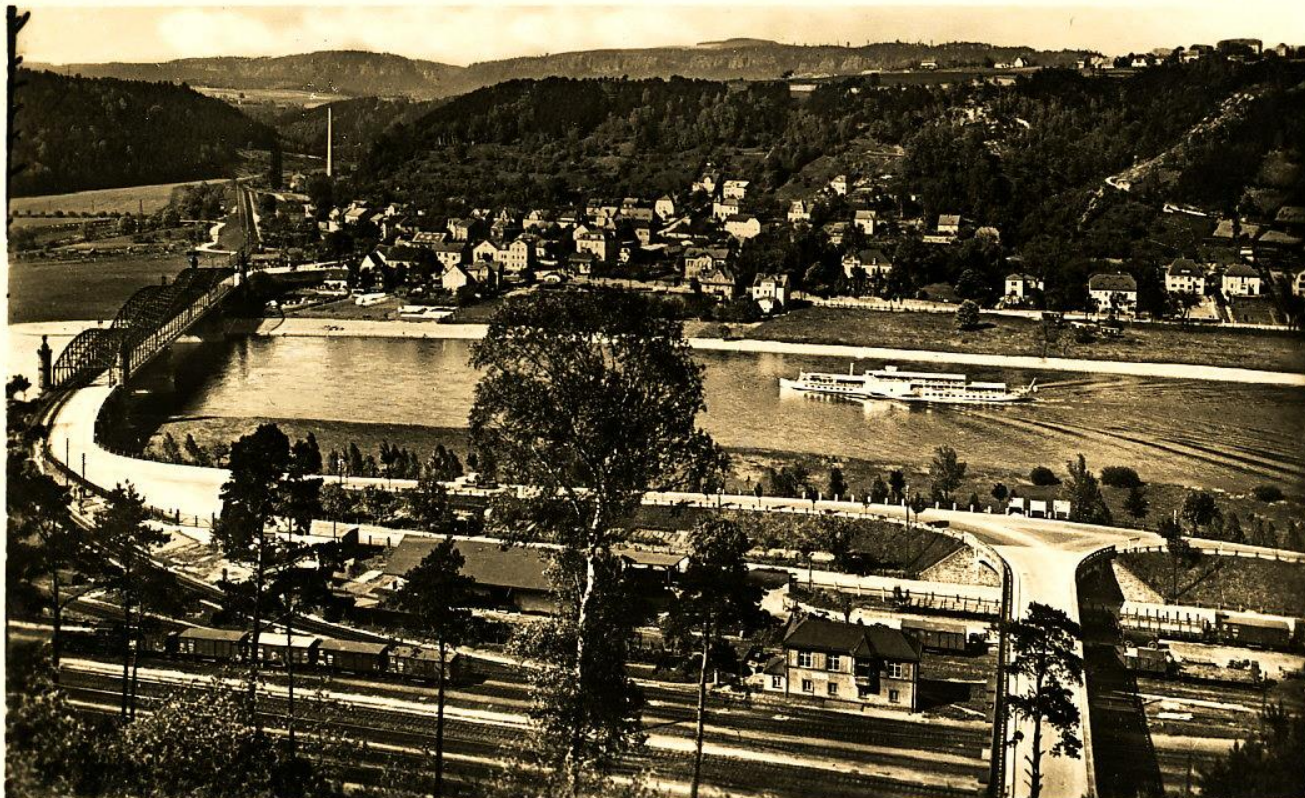
Kommunfreifige Ralfmannsdorf. Elbandflingeb. (Käff. Tjfnzig).