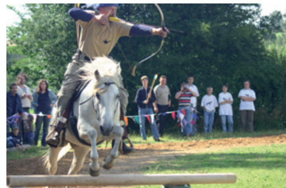
Bogenschießvorführung beim Hoffest