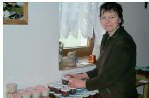
Wurstkonserven sind nur ein kleiner Teil des Angebotes in Frödens Hofladen