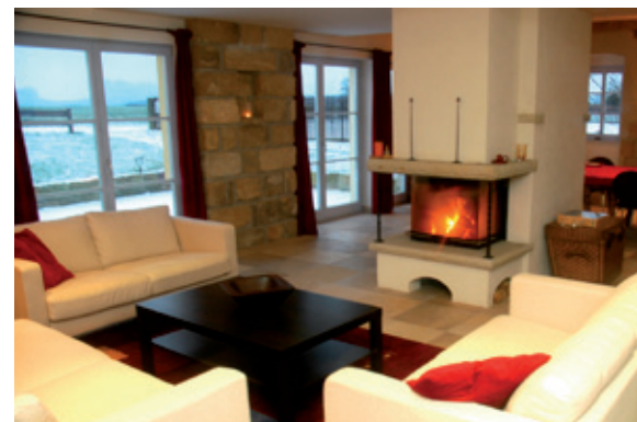
Exklusive Gästelounge mit Kamin