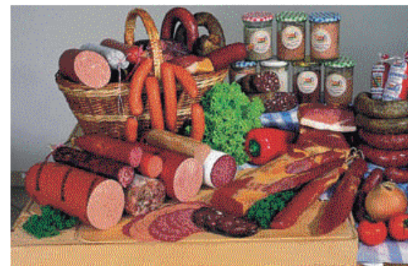
Produktpalette des Struppener Landschlachthofes