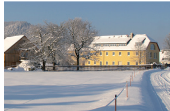
„Haus of Lords“ im Schnee

Gerade bei den Gastronomie-Tipps legen wir Wert auf Restaurants mit saisonaler, frischer und qualitative hochwertiger Küche. Und weil Frische eigentlich nur aus der nächster Nähe kommen kann, sind regionale Zulieferer fast selbstverständlich. Selbige nutzen wir auch, um unsere Frühstückskörbe zu füllen. Diesen Service bieten wir unseren Gästen an, die nur für ein langes Wochenende mal die Seele in der Sächsischen Schweiz baumeln lassen wollen oder auch ausländischen Gästen, für die das Einkaufen vor Ort wegen der Sprachbarriere zum Problem werden könnte. Bei diesen Körben – die je nach Wunsch auch nur mit Bio-Produkten gefüllt werden können – legen wir Wert auf regionale Produzenten. Denn die Lebensqualität der Region drückt sich nicht nur in der Natur selbst aus, sondern auch darin, welche Produkte sie dank hiesiger Erzeuger hervor bringt.