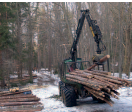
Waldpflege unter idealen Bedingungen – auf gefrorenem Boden fallen erheblich weniger Schäden an Waldboden und Wegen an.

Tiefe Spuren auf Wegen und Arbeitsgassen hinterlässt mancherorts derzeit die Waldpflege der Nationalparkverwaltung, wie aufmerksame Besucher bei Wanderungen durch den Nationalpark wiederholt festgestellt haben. Tatsächlich erschwert die derzeitige Witterung die schonende Durchführung notwendiger und unaufschiebbarer Waldpflegearbeiten erheblich: statt Frost und Schnee kämpfen Mensch, Tier und Maschine