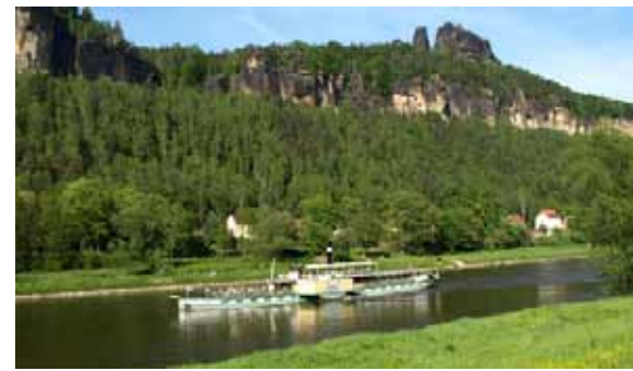
Ab 2. Mai wieder ein gewohntes Bild - Elbdampfer unter den Schrammsteinen

Eine Gemeinschaftsinitiative der Sächsische Dampfschiffahrts-GmbH & Co. Conti Elbschiffahrts KG und des Staatsbetriebs Sachsenforst, Nationalparkverwaltung Sächsische Schweiz