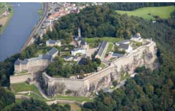
Die Festung Königstein aus der Luft