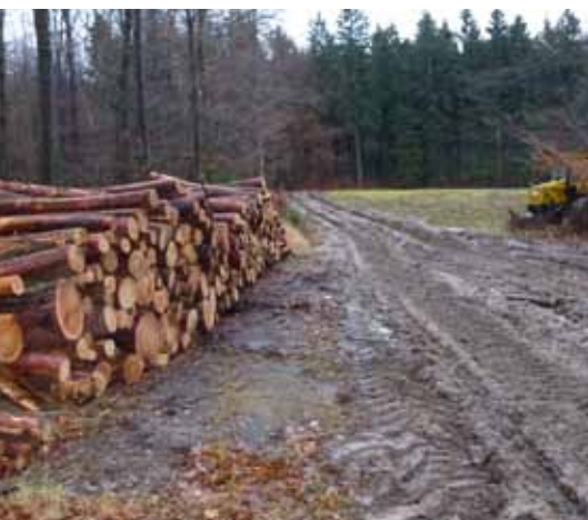
Wegeschäden durch Holzurückung Anfang Januar am Elbleitenweg bei Schmilka fielen aufgrund der nassen Witterung zum Teil erheblich aus. Nach Abschluss der Arbeiten werden die Wege wieder instand gesetzt.

sich bei frühlingshaften Temperaturen durch aufgeweichte Böden und Wege. Wäre ein Teil der Schäden dennoch vermeidbar?