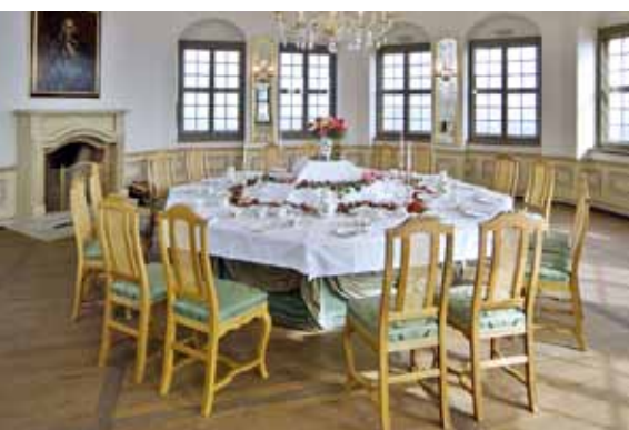
Die „Maschinentafel“ in der Friedrichsburg