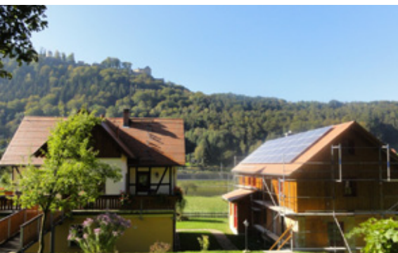
Der Drahteselhof versorgt sich teilweise selber über eine Solaranlage mit Strom