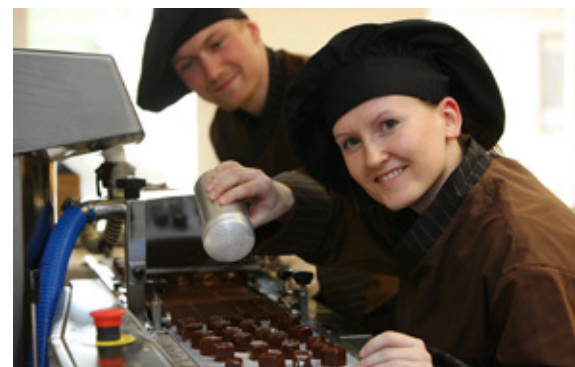
Zur Schokoladenherstellung gehört auch eine Prise Zimt