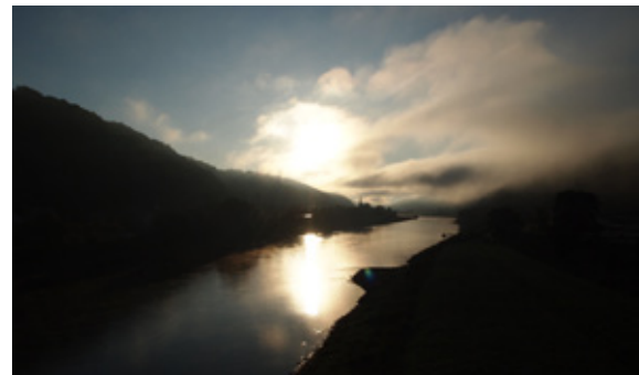
Morgenstimmung am Nationalpark-Bahnhof Bad Schandau