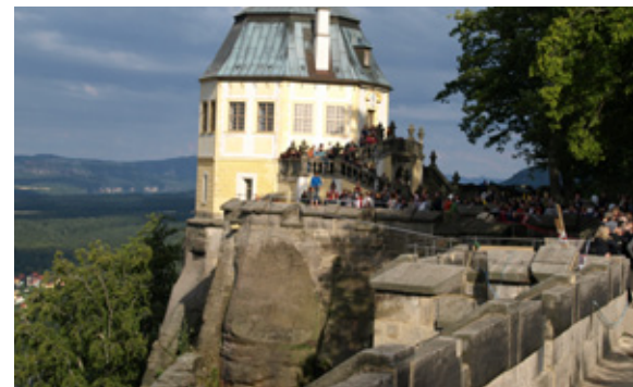
Die Friedrichsburg ist ein markantes Wahrzeichen der Festung Königstein.