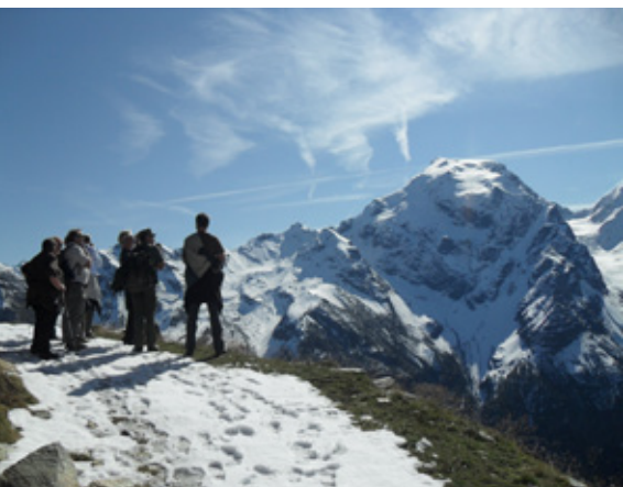
Blick auf den Ortler – mit 3905 m das Wahrzeichen des Nationalparks im Vinschgau