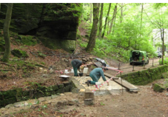
Brückensanierung im Uttewalder Grund