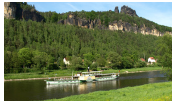
Ab 2012 wieder ein tägliches Bild – Dampfschiffe unter den Schrammsteinen.