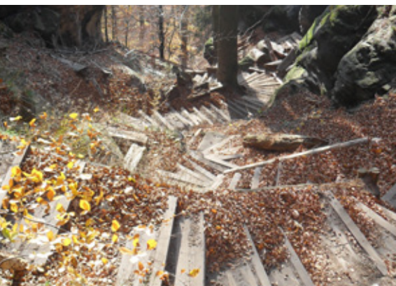
Die 840 Brandstufen sind wieder begehbar.