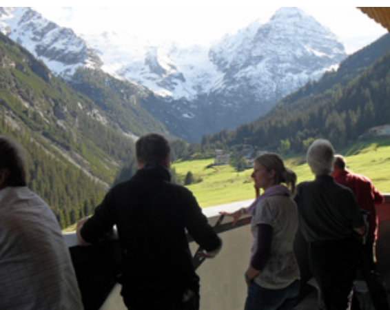
Blick vom Balkon des Naturatrafoi auf die Ortler-Gruppe