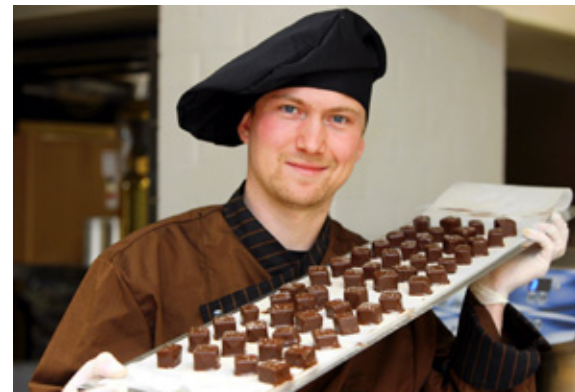
Die Trüffel für die Weihnachtszeit sind bald fertig