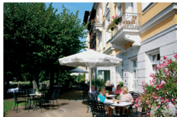
Hotel Lindenhof Bad Schandau mit gemütlicher Gartenterrasse

Auch Kinder kommen im Hotel voll auf ihre Kosten. Bei den regelmäßig stattfindenden Kinderkochkursen können Kinder von 8 bis 13 Jahren mit großem Eifer schnip-peln, schälen, rühren und lernen dabei die gesunden Produkte aus der Region kennen. Anschließend falten die kleinen Köche Servietten, decken den Tisch liebevoll ein und servieren kniggegerecht leckere Gerichte, die sie zum Abschluss verkosten.