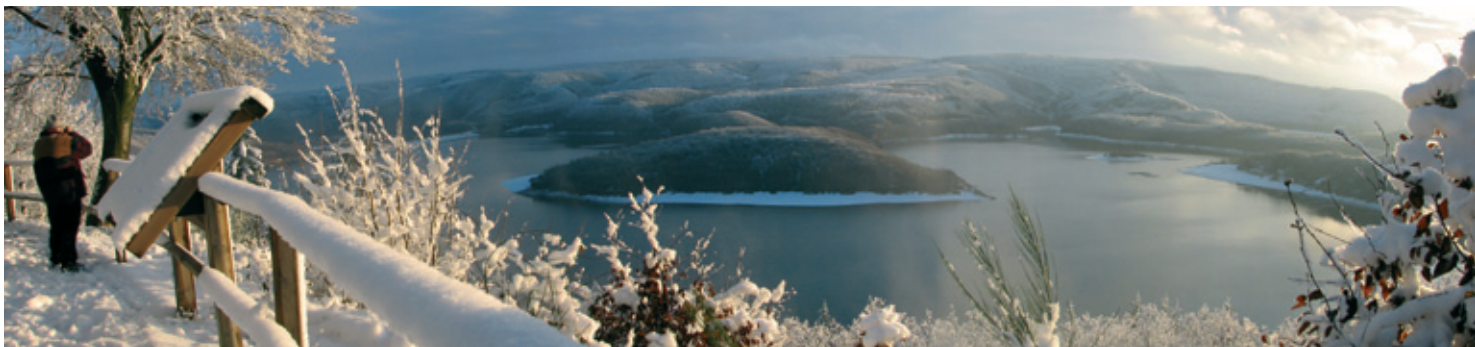
Aussichtspunkt „Schöne Aussicht“ mit Blick auf den Rursee und den Nationalpark Eifel