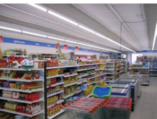
Wir wünschen dem neuen Landmarkt in Zinnwald, dem höchstgelegenen Ort des Landkreises, eine zufriedene Kundschaft.