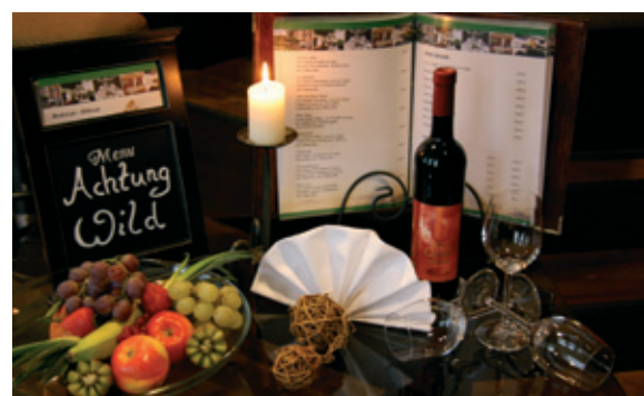
regionale Spezialitäten im altdeutschen Restaurant