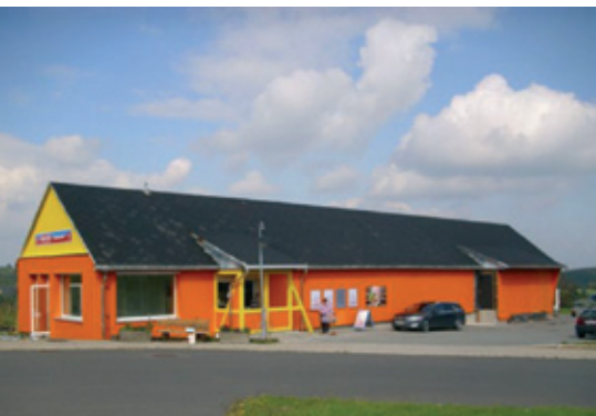
Landmarkt in Zinnwald erstrahlt im neuen Glanz