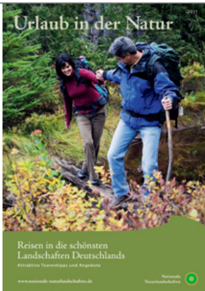
„Urlaub in der Natur“ heißt die neue Broschüre mit attraktiven Angeboten aus den Nationalen Naturlandschaften Deutschlands für das Jahr 2011.