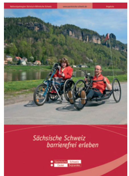
bestellt werden und ist unter www.saechsische-schweiz.de auch in elektronischer Form abrufbar.

Die kostenlose Broschüre „Sächsische Schweiz barrierefrei“ kann direkt beim Tourismusverband Sächsische Schweiz e.V. unter info@saechsischeschweiz.de oder Tel. 03501 4701-47