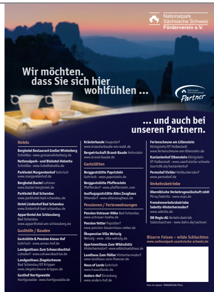
Ein neuer Wanderführer über die Sächsische Schweiz ist erschienen. An prominenter Stelle (Buchrückseite) konnten sich die 29 Nationalparkpartner präsentieren.