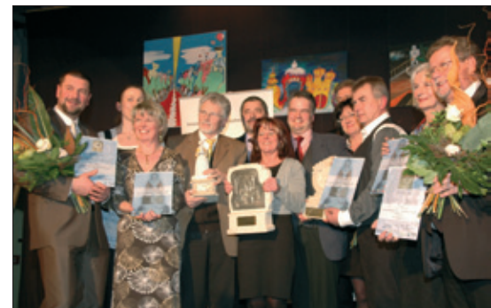
Die glücklichen Preisträger des diesjährigen Pokals

Wir vom Redaktionsteam gratulieren recht herzlich!