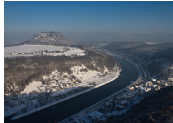
Der Lilienstein am 2. Advent 2010