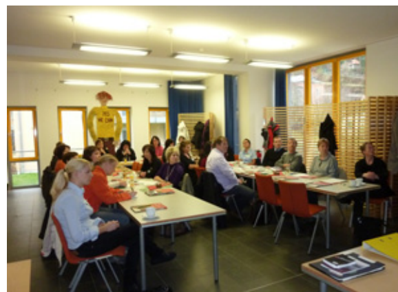
Weiterbildung für Touristiker