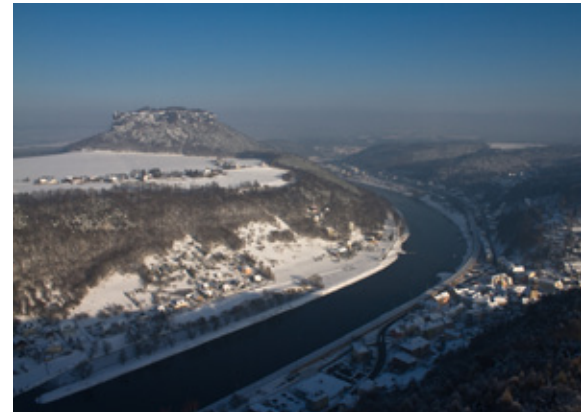
Der Lillienstein am 2. Advent 2010