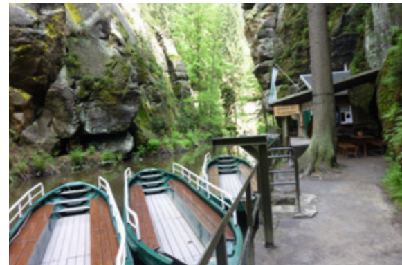
Boote an der Oberen Schleuse

Obere Schleuse Hinterhermsdorf ist täglich von Ostern bis Oktober geöffnet.