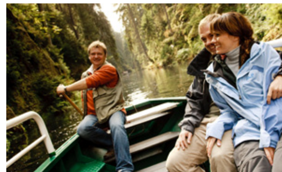
„Eine Kahnfahrt, die ist lustig, ...“