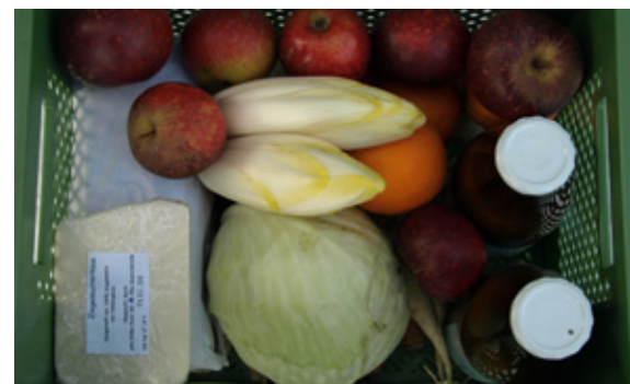
Angebote entsprechend der Jahreszeit