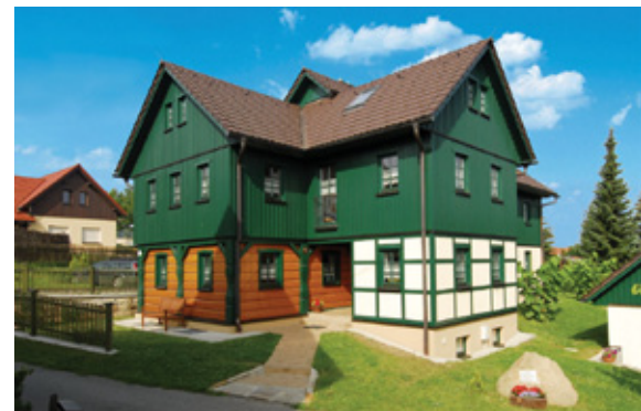
Landhaus „Zum Flößer“ im Umgebendhausstil