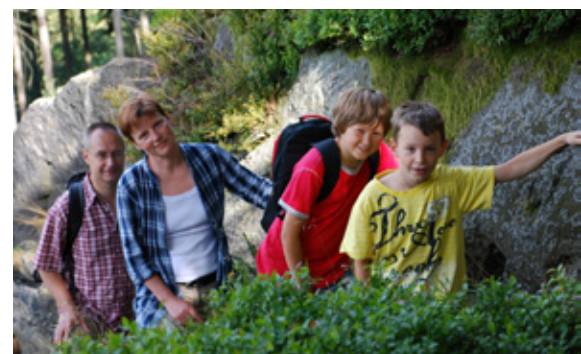
Erholung für die ganze Familie in gesunder Natur