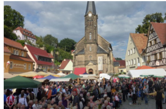
Gewohnt großer Andrang auch in diesem Jahr auf dem Naturmarkt in Wehlen

An dieser Stellen noch einmal vielen Dank an alle Unterstützer und Standbetreiber, welche wieder mit viel Aufwand mit der Ausgestaltung Ihrer Stände zum Gelingen des Marktes beigetragen haben.