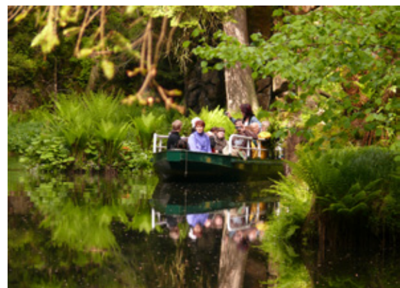
Zweiter Saisonstart der Historischen Kahnfahrt auf der Oberen Schleuse Hinterhermsdorf (siehe Artikel Seite 4)