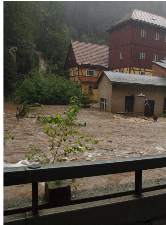
Hochwasser an der Buschmühle am 07.08.2010

Bei Bedarf stellt der DRK Kreisverband Spendenquittungen für Spenden ab an einer Höhe von 200 Euro aus. Dazu bitte eine Mail mit der überwiesenen Summe und der Adresse an: rettungsdienst@drk-sebnitz.de senden. Die Spendenquittung wird dann zugeschickt. Für alle anderen Spenden gilt fürs Finanzamt üblicherweise der Einzahlungsbeleg.