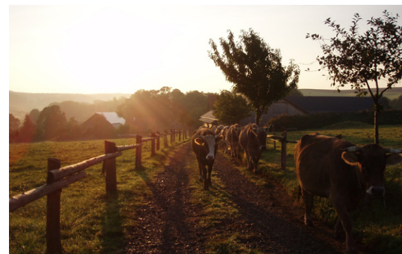
Auf dem Weg zur Weide