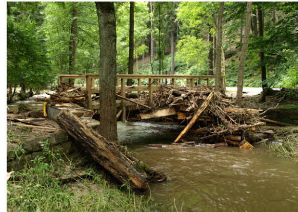
11.08.2010 Die Kirnitzsch ist wieder zurück in ihrem Bett