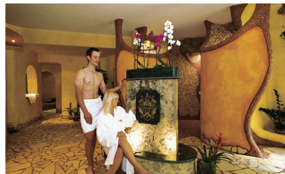
Wellness-Oase für die Gästeseelen