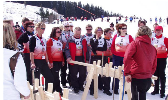
Teilnehmer des LINC-Treffens beim Schneeschuhe-wettkampf im März 2010 in Tirol

Genauere Informationen zu LINC finden Sie auf der Webseite www.info-linc.eu