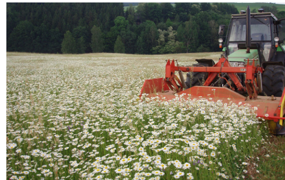
Mahd im Frühsommer