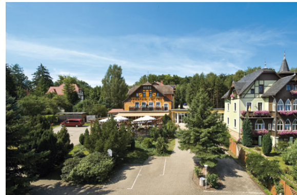
Gebäudeensemble des "Parkhotels Margaretenhofes"