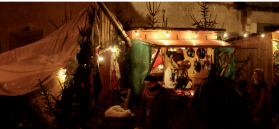
Historisch-romantischer Weihnachtsmarkt auf der Festung Königstein