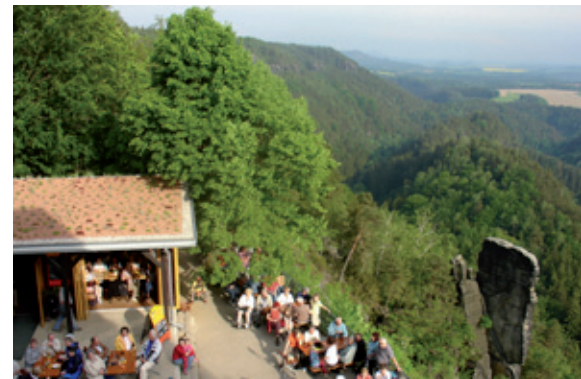
Bei schönem Wetter genießen unsere Gäste den Blick bis nach Böhmen

Von Oktober bis April geht die Saison der Bauden-Abende. Ein- bis zweimal monatlich veranstaltet die Brand-Baude dann ab 19:00 Uhr Vorträge, Lesungen oder Konzerte. Ein Bus-Shuttle befördert all jene, die den abendlichen Fußwegscheuen wieder nach Hohnstein.