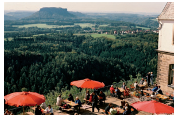
Die Brandaussicht - der Balkon der Sächsischen Schweiz