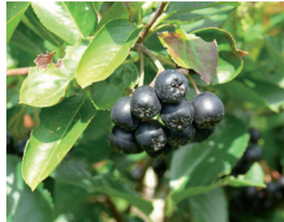
Aroniabeere ( Aronia melanocarpa )

Quellen: Wellnessfinder e.K., München; Arbeitsgemeinschaft Aroniabeere (2006-2009), Dresden