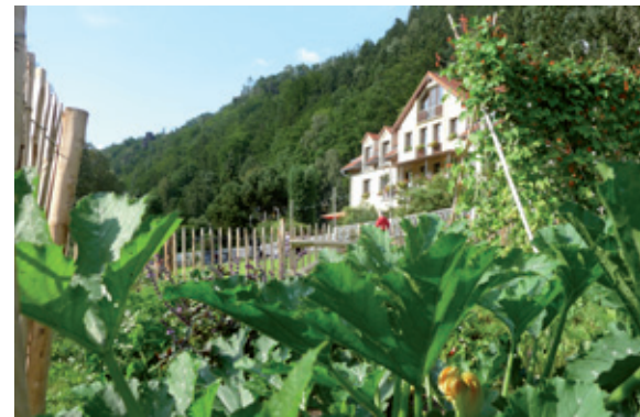
Viele Zutaten werden im eigenen Kräuter- & Gemüsegarten angebaut.