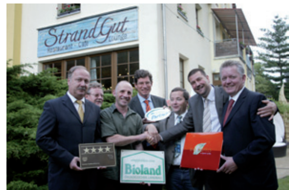
Zur Eröffnungsfeier am 2. Juni 2009 wurden gleich vier Plaketten übergeben.