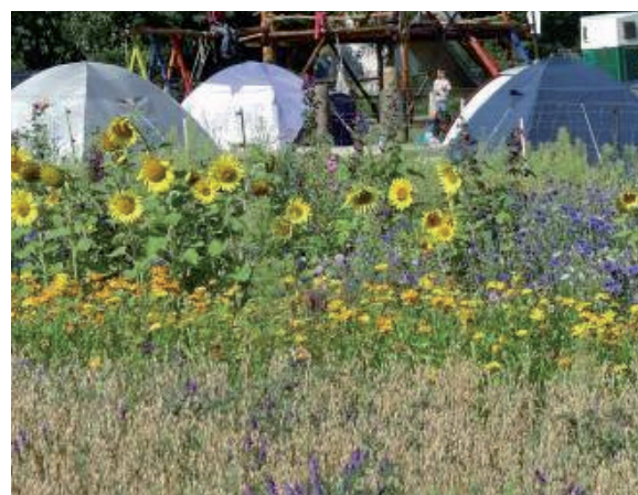
Permakultur hautnah erlebbar - rund um die Uhr