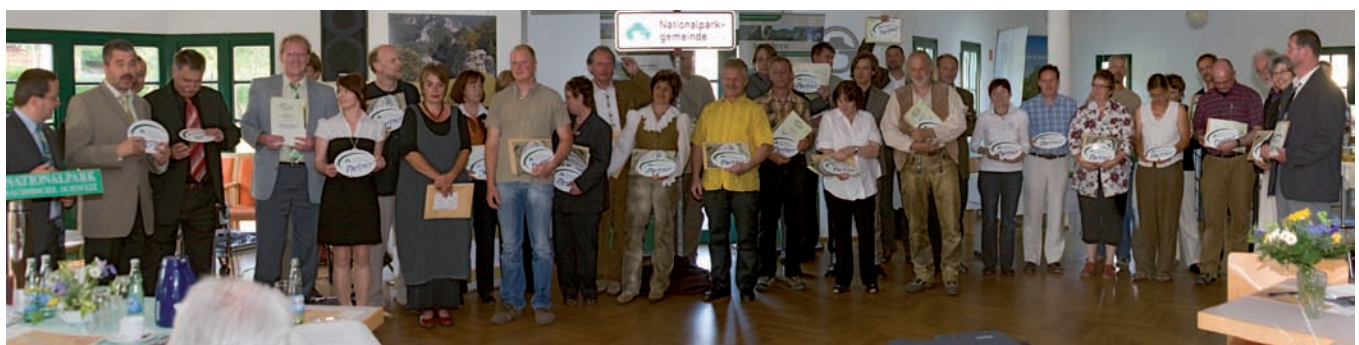
Zertifizierung der ersten Nationalparkpartner am 13. Mai 2009 im „Haus des Gastes“ in Hinterhermsdorf

Somit leisten der Nationalpark und der Nationalparkförderverein jeder auf seine Weise ihren Beitrag zur Regionalentwicklung in der Sächsischen Schweiz.