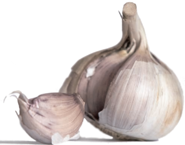
Knoblauch ( allium sativum )

Immer noch pflegen in manchen ländlichen Gegenden (z.B. Sizilien) die „Hexen“ den Knoblauch in kleinen Stückchen mit ein wenig Salz und ein paar Tropfen Öl in eine Schüssel Wasser zu geben, in die man eine Haarsträhne der Person taucht, die vom bösen Blick befallen ist und mit ein paar Zauberformeln verschwindet der böse Blick wie durch Zauberei.